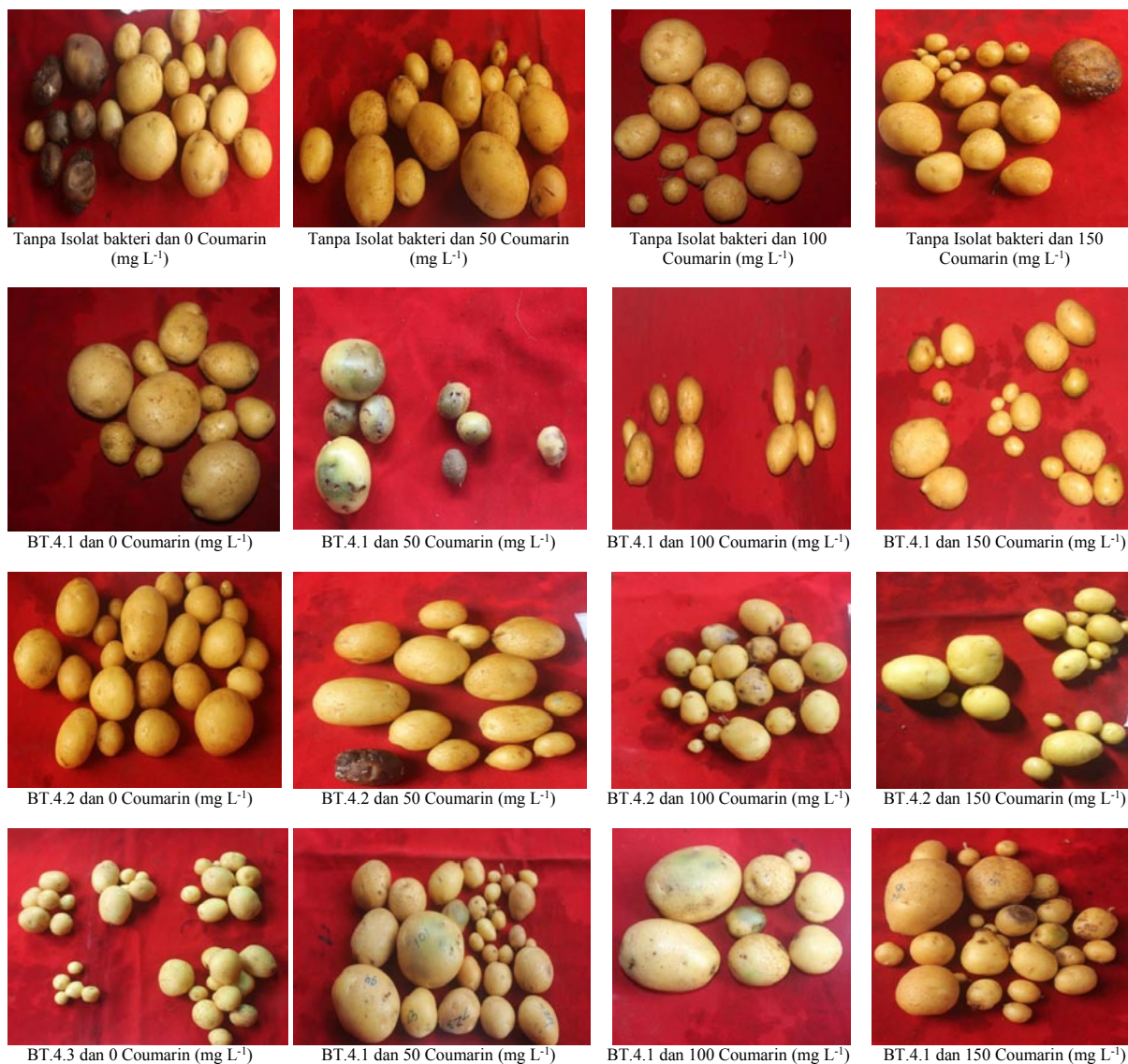
Gambar 2. Umbi kentang Granola setelah panen pada umur 100 HST

Keterangan: *Angka-angka pada arah vertikal yang diikuti huruf kecil yang sama berbeda tidak nyata berdasarkan uji BNJ taraf 5%. **Data yang disajikan adalah data asli, untuk sidik ragam dan BNJ adalah data transformasi \sqrt{X+1}