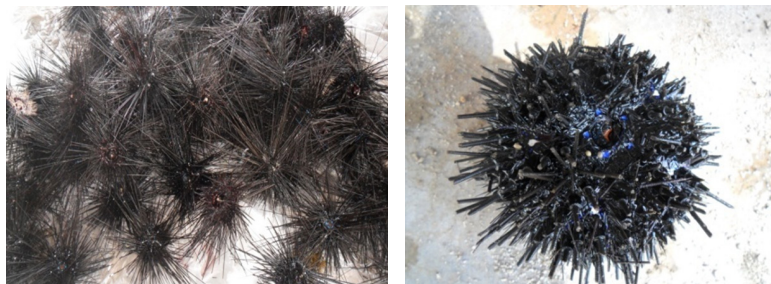
Gambar 1 Diadema setosum

Bagian bulu babi yang menghasilkan rendemen tertinggi adalah gonad yakni 7,10% dan terendah adalah duri yakni 0,94%. Rendemen gonad bulu babi yang tinggi mengindikasikan banyak komponen bioaktif yang mampu diekstrak oleh pelarut metanol.