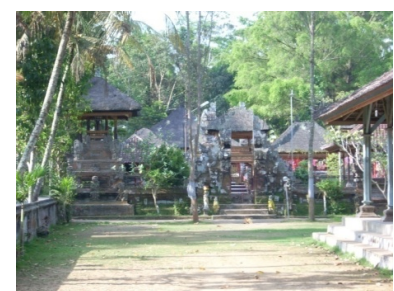
Gambar 4. Suasana Pura Hyang Api di Desa Kelusa Saat Tidak Ada Perayaan