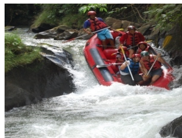
Gambar 1. Kegiatan Rafting di Sungai Ayun

Desa Pakraman Pausan merupakan salah satu banjar di Desa Buahhan Kaja yang memiliki kekhasan adat dan budaya yang berbeda dari masyarakat Bali pada umumnya (Gambar 2). Dalam pelaksanaan kegiatan keagamaan terdapat struktur kepemimpinan sesuai dengan bidang tugasnya masing-masing, yang terdiri dari Jero Bayan (kiwa & tengen), Jero Bau (kiwa & tengen), Jero Bendesa Adat , Jero Singgukan dan Jero Malungan . Setiap sepuluh tahun sekali diadakan Upacara Nyelung di Pura Pucak Pausan, sebuah ritual persembahan segala macam hasil bumi yang dilak-