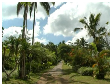
Gambar 5. View Kawasan Perkebunan Bunga di Agrowisata Payangan

Agrowisata Payangan dikembangkan di dua desa yaitu Desa Kerta dan Desa Buah Kaja. Kedua desa ini merupakan penghujung utara dari Kecamatan Payangan dengan wisata alamnya. Agrowisata Payangan menawarkan beberapa pilihan wisata antara lain: wisata desa, tracking , buggy/quad , wisata edukatif, kawasan perkebunan bunga (Gambar 5), perkebunan kopi, perkebunan jeruk, dan pertanian terintegrasi.