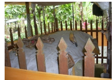
Gambar 3. Sarkofagus yang Ada di Desa Bukian

Aci Keburan merupakan ritual unik dan khas yang dilaksanakan di Pura Hyang Api (Gambar 4), di Desa Kelusa dengan jarak kurang lebih 100 m sebelah Utara Kantor Desa Kelusa. Pelaksanaan ritual ini melalui adu ayam yang dilakukan secara masal untuk nawur sesangi (membayar kaul) atas permohonan kesembuhan dan keberhasilan dalam beternak. Tradisi ini dilaksanakan setiap enam bulan wuku (setiap 210 hari sekali), selama 42 hari yang dimulai pada Hari Raya Kuningan Umat Hindu. Masyarakat yang memedek (hadir) untuk nawur sesangi hampir dari seluruh Bali (Supartha, 1996).