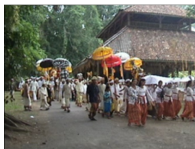
Gambar 2. Kegiatan Upacara Keagamaan di Pura Pucak Pausan

sanakan oleh semua krama subak di Buahhan Kaja dan Buahhan Kelod.