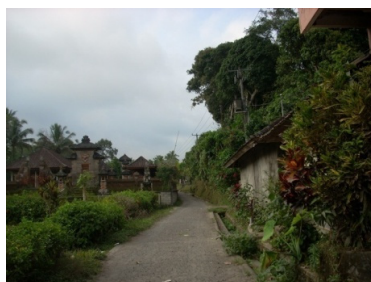
Gambar 6. Suasana Nyepi Kasa di Desa Pakraman Buah