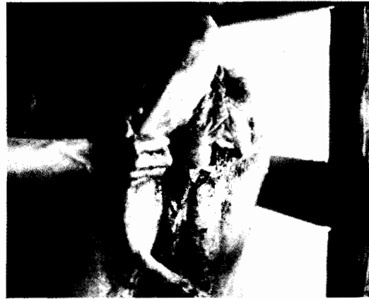
Gambar 5. Luka miasis tahap lanjut, sudah menjadi borok busuk.