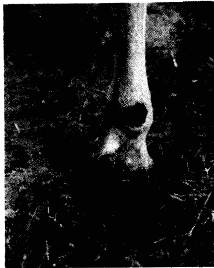
Gambar 1. Luka miasis pada teracak sapi. (a) tahap dini, (b) tahap lanjut, sudah ditutupi kerak.