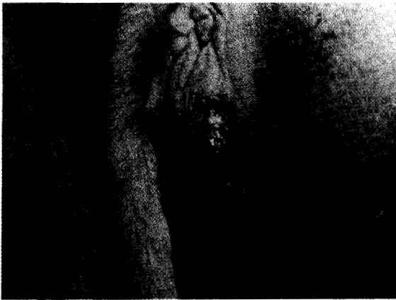
Gambar 4. Luka miasis di dekat vulva yang masih segar dengan darah mengalir ke luar.